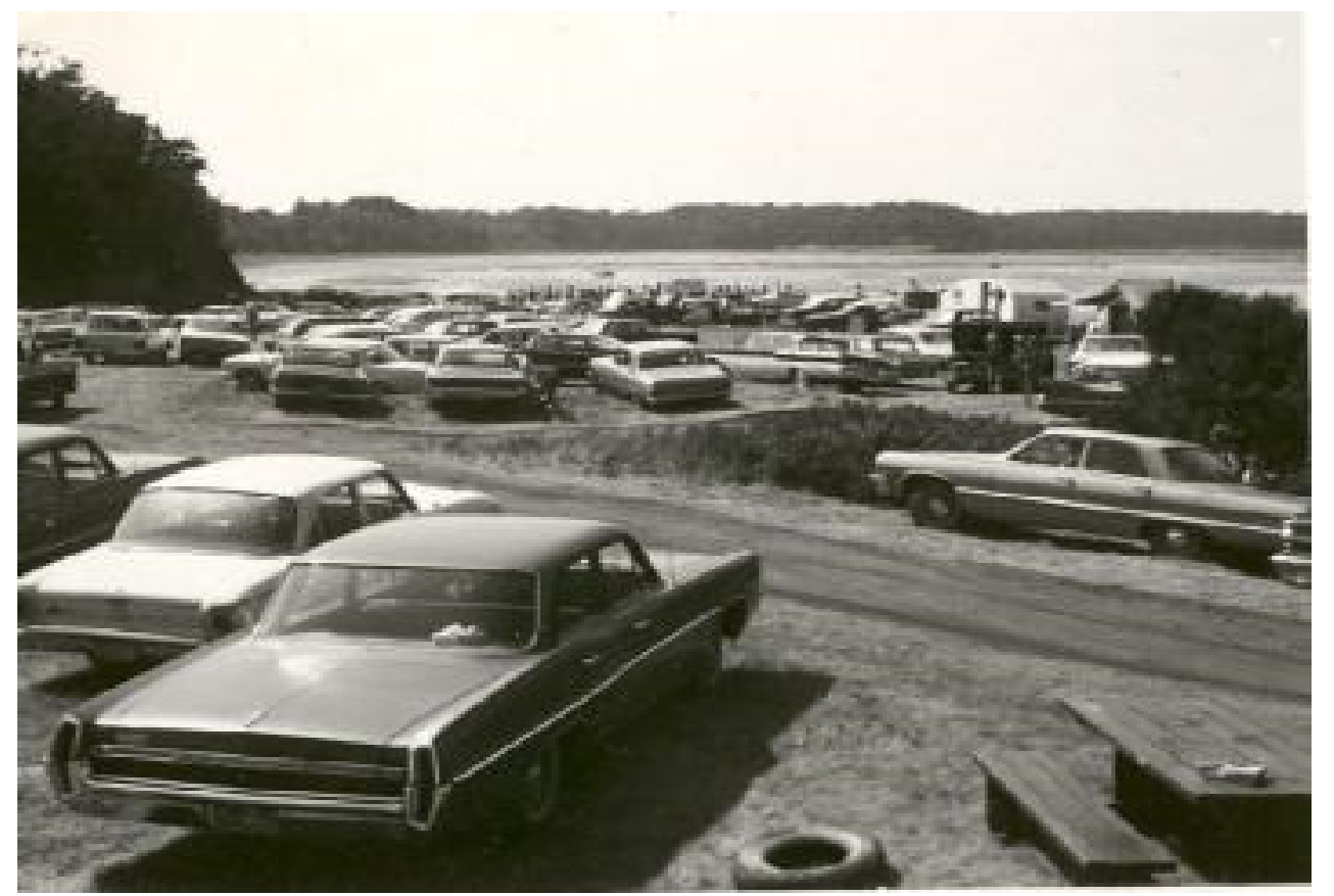
Foule à l'embouchure de la rivière Mitis